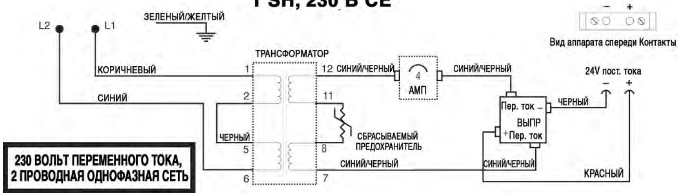
СХЕМА МОДЕЛИ 2 SH, 230 В СЕ