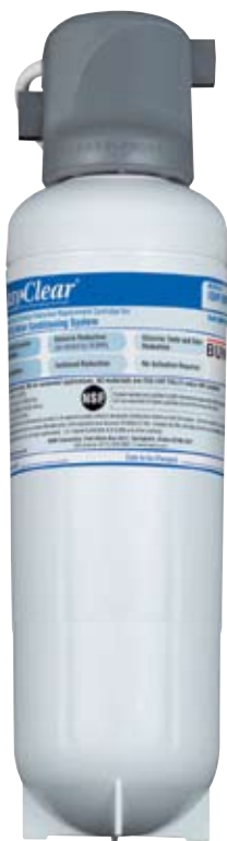
Modèle EQHP-35L Système de filtration de l'eau