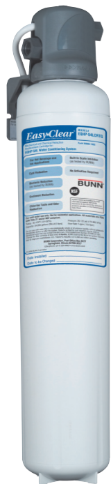
Modèle EQHP-Thé Système de filtration de l'eau