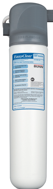
Modèle EQHP-10L ou EQHP-10 Système de filtration de l'eau