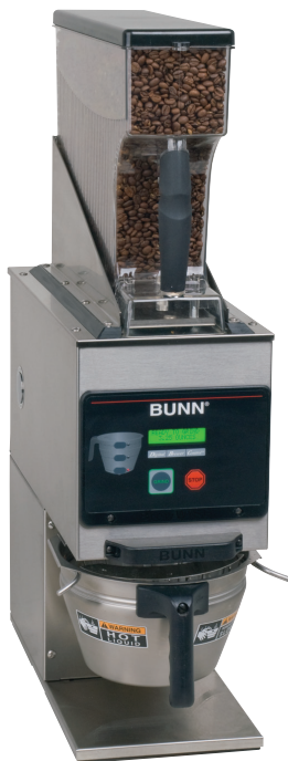
Modèle G9WD-RH (Entonnoir vendu séparément) (Comprend une trémie)

Dimensions: 29,8 po H x 8,14 po L x 19,3 po P (75,7cm H x 20,7cm L x 49,0cm P)