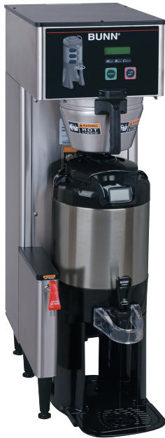
Modèle Single TF DBC illustré avec serveur TF 1,5 gallon (serveur vendu séparément)

Dimensions: 35,7po" H x 12,1 po L x 19,2 po P (90,7cm H x 30,7cm L x 48,8cm P)