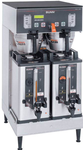
Modèle Dual SH DBC serveurs SH 1,5 gallon