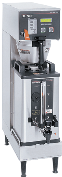
Modèle DBC single SH Illustré avec serveur SH 1,5 gallon* (serveur vendu séparément)

Dimensions: 35,8 po H x 9,3 po L x 23,1 po P (90,9 cm H x 23,6 cm L x 53,8 cm P)